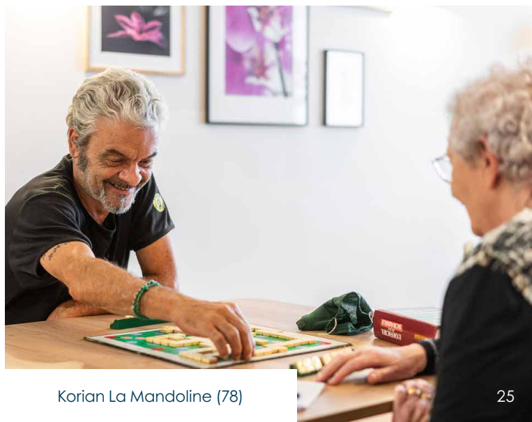
Korian La Mandoline (78)

L'Allocation Journalière du Proche-Aidant (AJPA) : mise en place depuis 2020, elle s'adresse à toute personne résidant en France qui arrête partiellement ou totalement une activité professionnelle pour s'occuper d'un proche en situation de handicap ou de perte d'autonomie. Cette aide financière est versée par la CAF ou la MSA (Mutualité Sociale Agricole) selon le régime de rattachement.