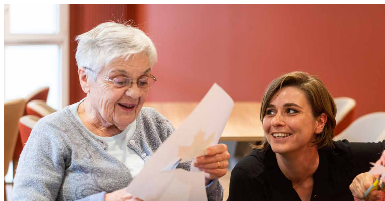
Korian La Mandoline (78)

Dans les maisons Korian, le résident sera toujours perçu au prisme de son histoire de vie, de sa personnalité, de ses envies et de toutes ses capacités préservées. Nous lui proposons ainsi un accompagnement adapté et personnalisé.