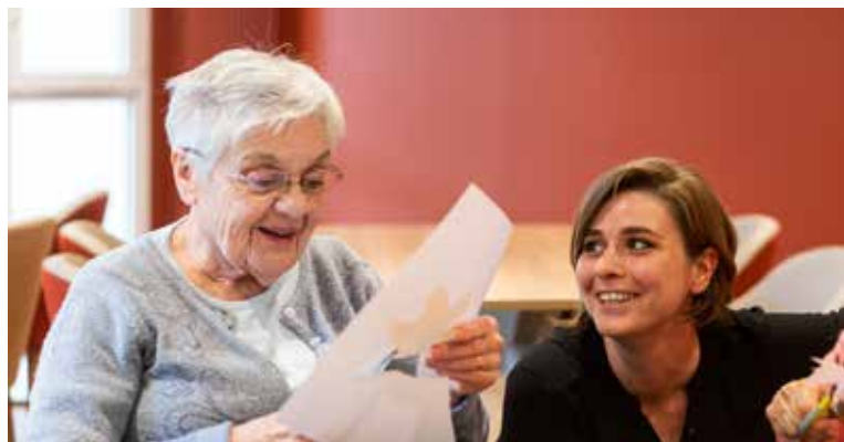
Korian La Mandoline (78)

Dans les maisons Korian, le résident sera toujours perçu au prisme de son histoire de vie, de sa personnalité, de ses envies et de toutes ses capacités préservées. Nous lui proposons ainsi un accompagnement adapté et personnalisé.