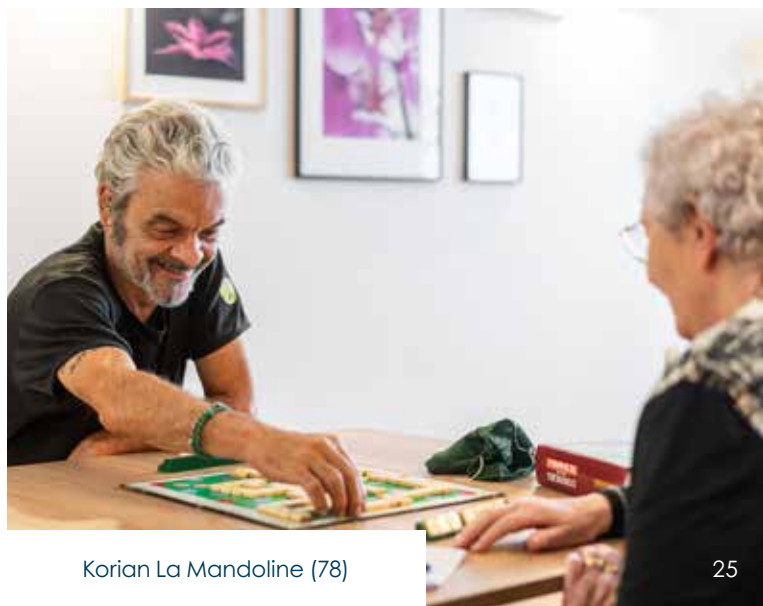
Korian La Mandoline (78)

L'Allocation Journalière du Proche-Aidant (AJPA) : mise en place depuis 2020, elle s'adresse à toute personne résidant en France qui arrête partiellement ou totalement une activité professionnelle pour s'occuper d'un proche en situation de handicap ou de perte d'autonomie. Cette aide financière est versée par la CAF ou la MSA (Mutualité Sociale Agricole) selon le régime de rattachement.